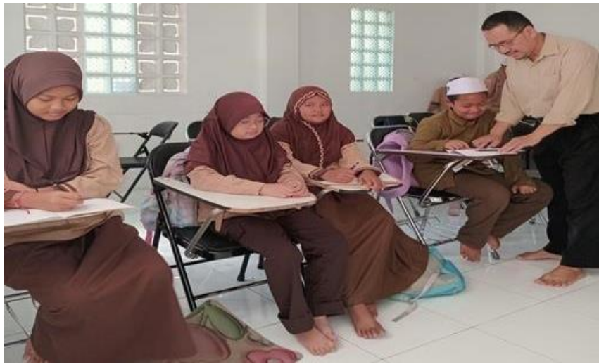
Gambar 1. Pelatihan Menulis Teks Prosedur

Pada pertemuan pertama dijelaskan tentang arti prosedur dan pengalaman pribadi. Sebagai kosakata yang jarang atau baru didengar, makna dari ujaran itu belum berterima dalam benak para peserta, Akan tetapi, ketika diberikan beberapa contoh, para peserta mulai mengetahui dan memahami. Ketika ditanya, umumnya para peserta mulai memahami maksud dari kosakata prosedur dan pengalaman pribadi, seperti cara membuat teh manis atau kopi. Tanda bahwa kosakata itu dipahami oleh para siswa tampak dari komunikasi nonverbal dengan menganggukkan kepala tanda yakin atau paham. Kemampuan memaknai kosakata yang dimaksud mengindikasikan siswa mengerti arti tersebut sehingga memudahkan pembelajaran tentang teks prosedur. Hal ini merupakan awal proses belajar mengajar yang positif dalam memahami pengertian prosedur dan pengalaman pribadi.